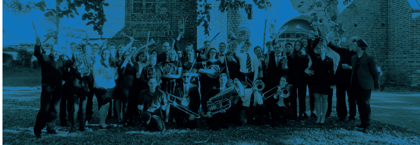
Konzert in der Pfarrkirche St. Georg, Wiek auf Rügen

Derzeit, in Schwerin, betätigt er sich als Musikpädagoge und Kirchenmusiker und widmet sich in der verbleibenden Zeit als Posaunist der Kammermusik.